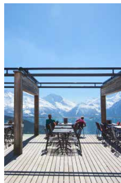
Boven: genieten van Walliser specialiteiten op het zonneterras van het historische hotel Belalp, met vol uitzicht op de Aletsch-gletsjer.