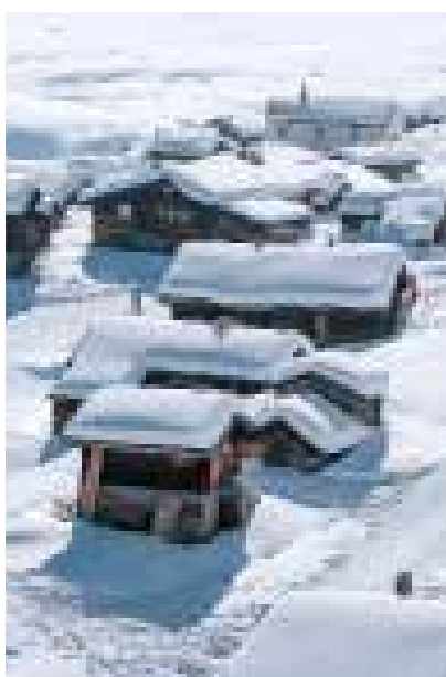
Niets verstoort het dikke pak sneeuw. De Belalp is gelukkig autovrij

O p de piste in de verte suizen skiërs in felgekleurde pakken naar beneden. Ze hebben alleen oog voor de volgende bocht en weten niet wat ze missen. Wij, staande op onze comfortabele sneeuwschoenen, voelen ons zo veel vrijer. Hier, buiten de piste, bepalen we zelf het tempo en kunnen ondertussen onbekommerd genieten van het betoverende witte landschap met imposante vierduizenders als de Eiger, Mönch en Jungfrau. Overall om ons heen ongerepte sneeuw. Meters dik en zo poederachtig vers dat het kraakt onder de voeten. Voor ons geen aangestampte pistes, maar de magie van zelf het eerste spoor zetten door een nog maagdelijk landschap.